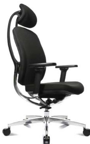
Ar auduma apdari